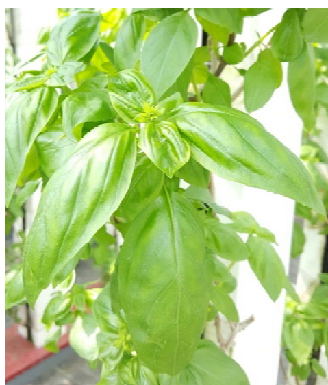
<栽培中のバジルの様子>

しかし、安心安全を求める消費者のニーズは年々高まっており、輸入品から国産への切り替えは急務となっています。